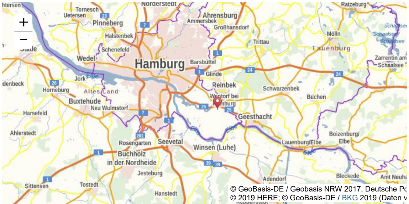
© GeoBasis-DE / Geobasis NRW 2017, Deutsche Post AG © 2019 HERE; © GeoBasis-DE / BKG 2019 (Daten v

Soziale Beratungsstelle Berge., Weidenbaumsweg 19, 21029 Hamburg, Bergedorf, Hamburg, Deutschland